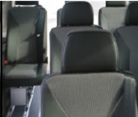
Confortable, seguro y asientos Smartseat ISOFIX, reposabrazos derecho y tapicería Volkswagen mixta.