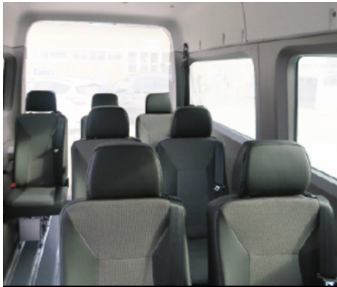
Opcional: Revestimiento deluxe, con guarnecidos Trims