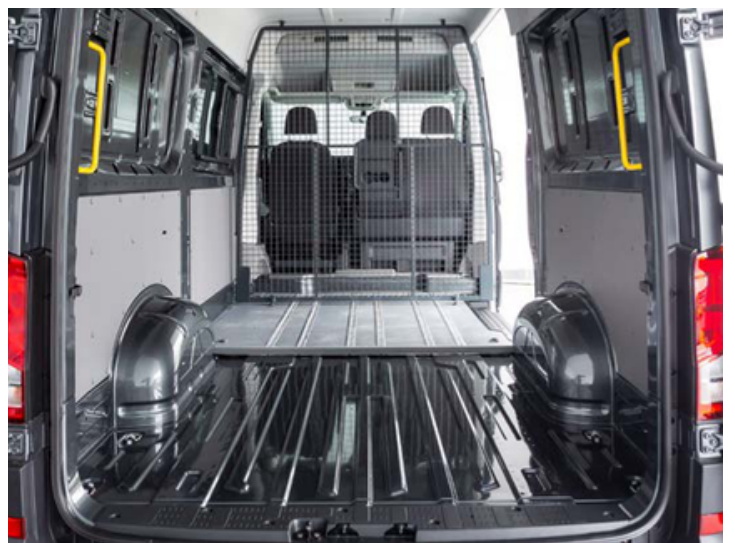
Asientos desmontables quick fix. Rejilla en posición para capacidad máxima de carga.

https://nuevostallerescodas.com/ - taller@nuevostallerescodas.com