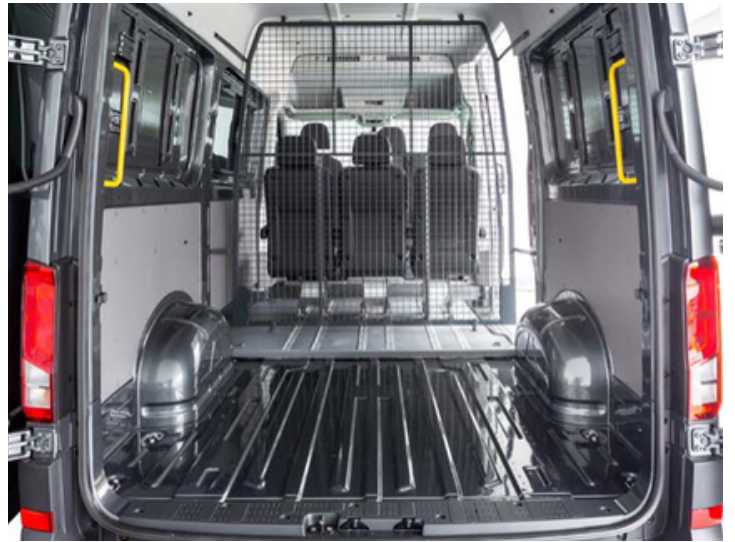
Configuración con una fila de asientos. Gran espacio de carga.