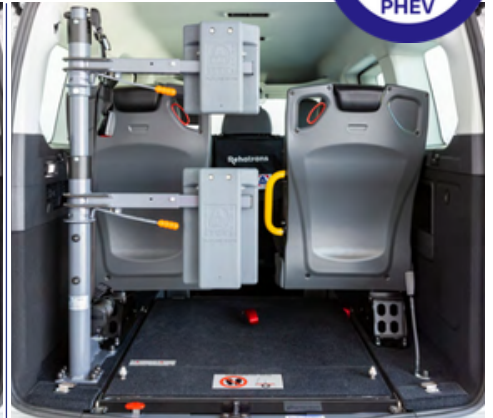
Opcionalmente, se puede equipar el vehículo con un respaldo y reposacabezas FUTURESAFE.