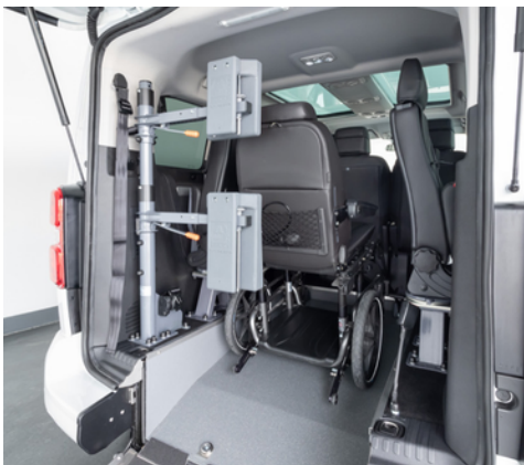
Opcionalmente, se puede equipar el vehículo con un respaldo y reposacabezas FUTURESAFE