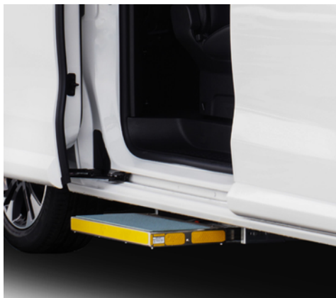
Peldaños y asideros opcionales y para vehículos del servicio público