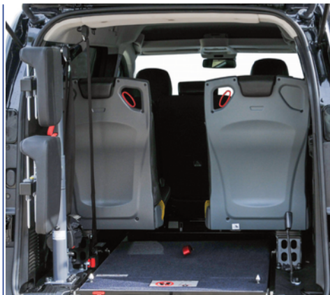
Asientos opcionales en tercera fila, para cuando no viaja el pasajero en silla de ruedas.