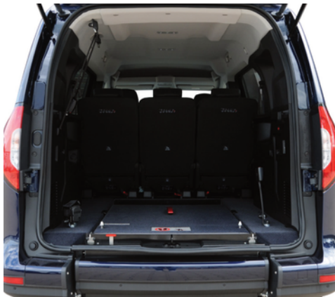
Su sistema EASYFLEX permite abatir la rampa y aprovechar el maletero.