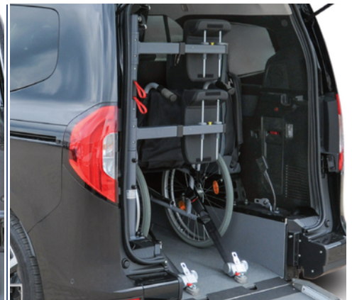
Opcionalmente, se puede equipar el vehículo con un respaldo y reposacabezas FUTURESAFE.