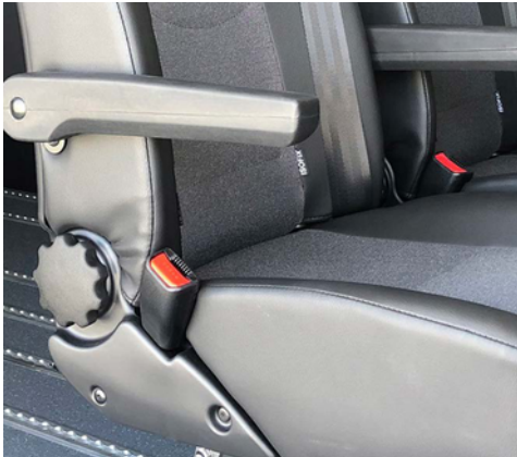
Confortables asientos Smartseat Standar o Premium*, ambos con tapicería mixta.