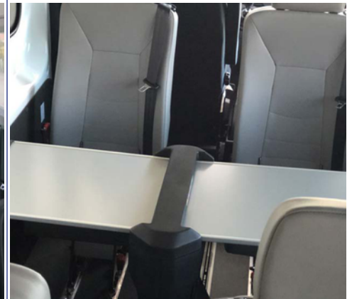
Mesa móvil en opción, fácil de plegar y con cierre suave. Se puede recoger entre asientos para ahorrar espacio.