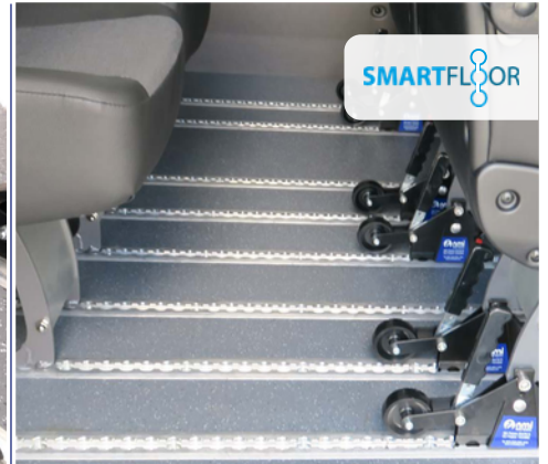
El suelo Smartfloor permite realizar diferentes configuraciones de forma rápida y flexible.