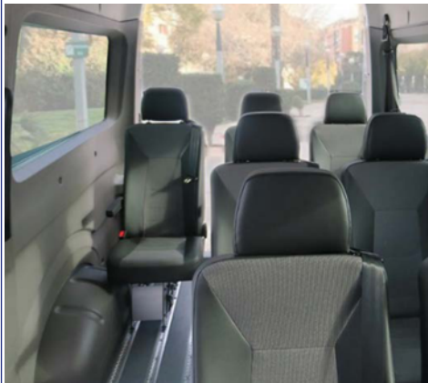
Opción de cobertores integrales que revisten completamente el interior.