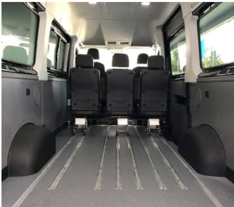
Opción de cobertores básicos.