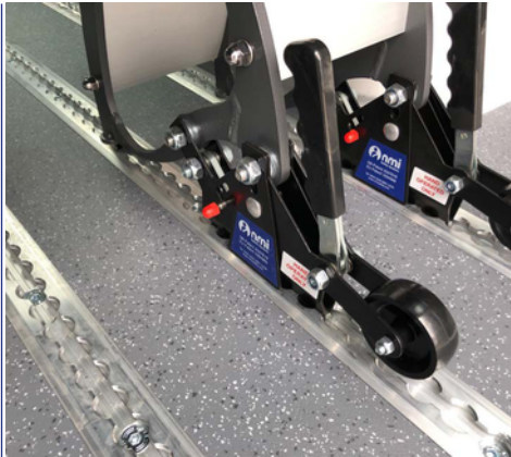
Los Smartseat Premium están equipados con ruedas para facilitar el transporte.