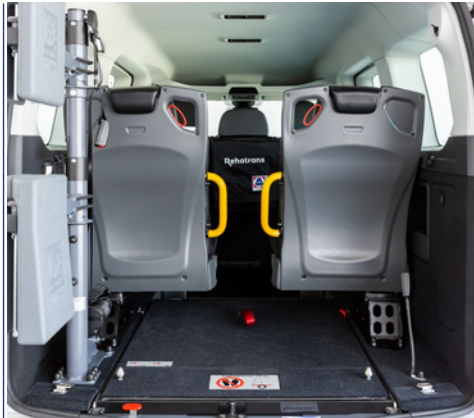
Asientos opcionales en tercera fila, para cuando no viaja el pasajero en silla de ruedas.