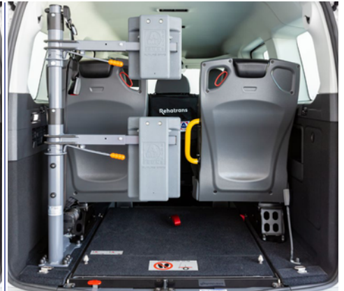
Opcionalmente, se puede equipar el vehículo con un respaldo y reposacabezas FUTURESAFE.