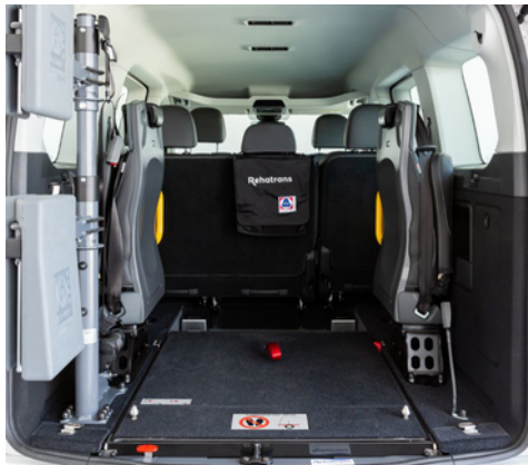
Su sistema EASYFLEX permite abatir la rampa y aprovechar el maletero.