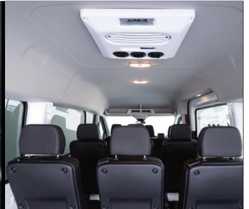
Sistema de climatización en las plazas traseras