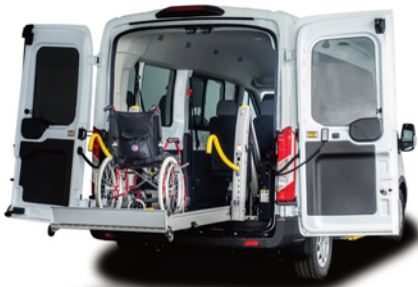
Gracias a la plataforma elevadora, se puede acceder al vehículo cómodamente en silla de ruedas