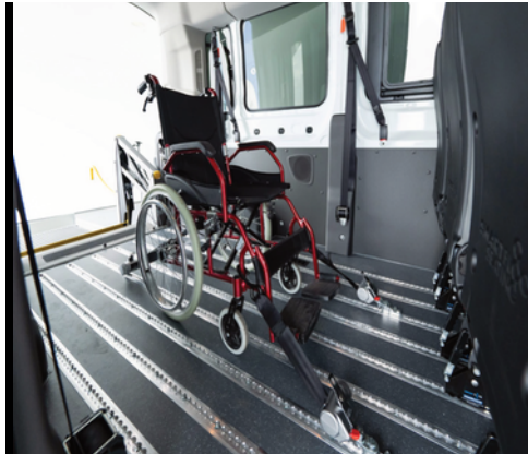
El suelo Smartfloor dota al vehículo de una gran flexibilidad a la hora de configurar el interior