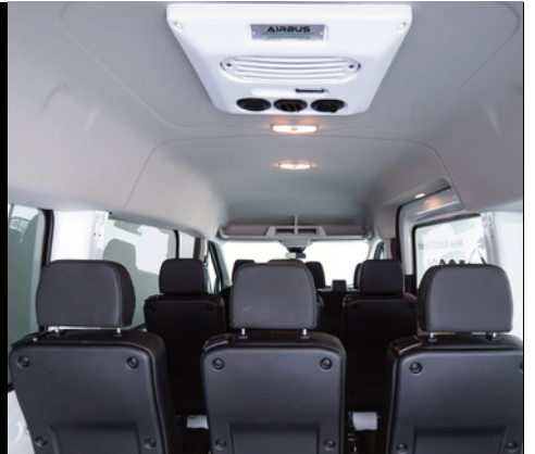
Sistema de climatización en las plazas traseras