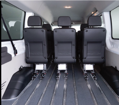
El suelo Smartfloor dota al vehículo de una gran flexibilidad a la hora de configurar el interior