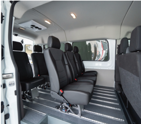
Adaptación homologada con categoría M1 para Pasajeros