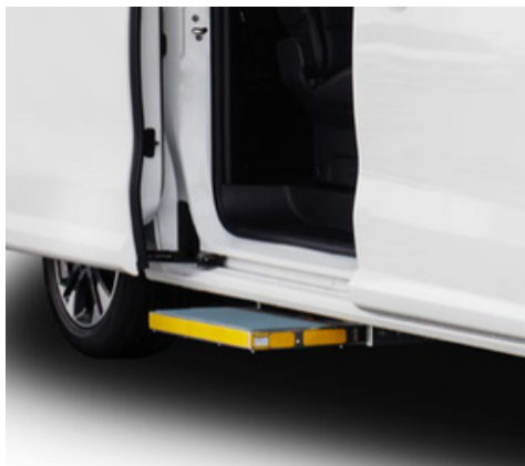
Peldaños y asideros opcionales y para vehículos del servicio público