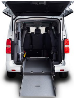
Rebaje de Piso con rampa de acceso manual. Ligera y resistente con capacidad de carga de hasta 350 Kg