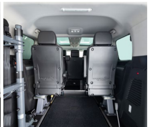
Los asientos opcionales de tercera fila , aumentan la capacidad del vehículo de 5 plazas+silla a 7 plazas.