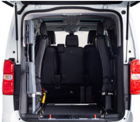
El sistema Easyflex permite abatir la rampa para aprovechar toda la capacidad del maletero o utilizar los 2 asientos opcionales en 3ª fila.