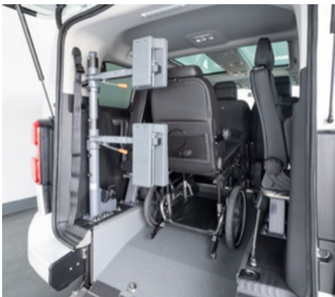
Opcionalmente, se puede equipar el vehículo con un respaldo y reposacabezas FUTURESAFE